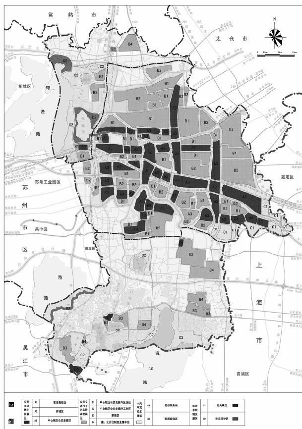
图3 昆山市域交通分区规划图